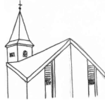
St. Cäcilia, Wenholthausen