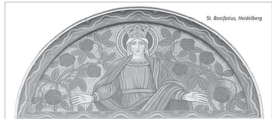
Im Mai feiert die Kirche die Gottesmutter Maria als Maienkönigin. Mitten im Frühling symbolisiert sie das blühende Leben, da sie Jesus das Leben geschenkt hat, durch den Gottes gute Schöpfung von der Vergänglichkeit des Todes erlöst wurde.

Für Fahrgelegenheiten wird auf Wunsch gesorgt. Der Kostenbeitrag liegt bei 3,50 Euro.