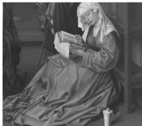
Am 22. Juli hat Maria Magdalena ihr Fest. In der Bibel begegnet sie uns als eine der Jüngerinnen, die Jesus nachfolgen. Und sie wird zur Erstzeugin von Ostern, zur „Apostelin der Apostel“, weil sie den Jüngern die Botschaft von der Auferstehung Jesu verkündet.