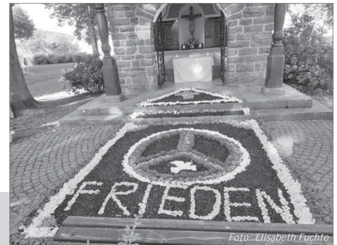
Blumentepich bei der Fronleichnamsprozession in Reiste