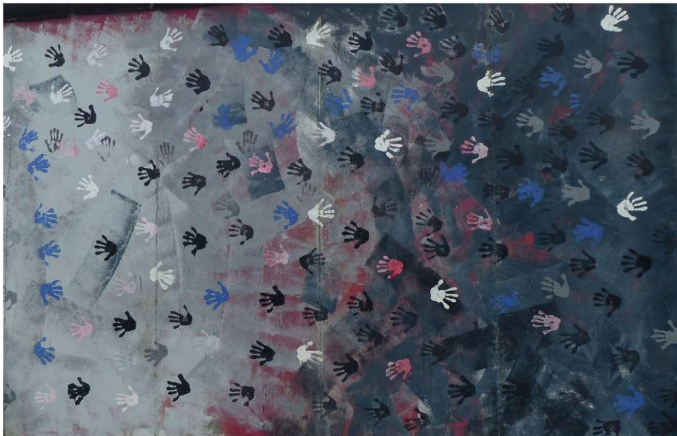
East-Side-Gallery, Berlin